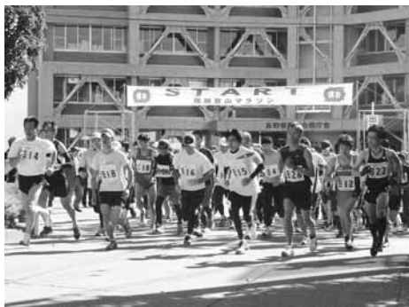
飯田合同庁舎スタート

各競技団体の皆さんには、早朝からスタッフとしてご協力いただき、ありがとございました。