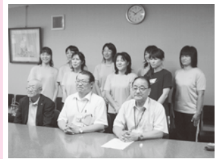
飯伊バスケットボール協会 第28回全国ママさん バスケットボール交流大会出場 (8月7日～9日) 7月27日表敬訪問(市役所)