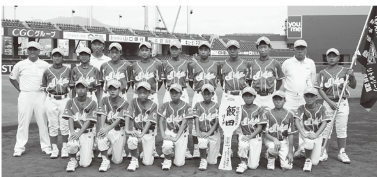
みごと全国選抜リトルリーグ野球大会出場!

当団は、硬式野球を通じて、飯田下伊那の小学生から中学生までの幅広い層の子供たちが、毎週土・日曜日、祝日に朝九時〜夕方五時まで活動しています。野球を通じて、心身を鍛え、挨拶や礼儀、野球道具はもちろんのこと、お借りしているグラウンドの手入れ等の指導に力を入れています。