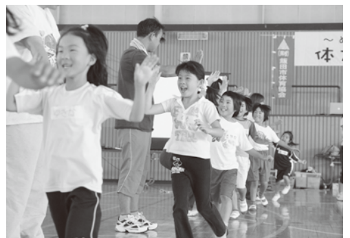
やったネ! できたネ! たのしかったネ!

一緒に野山を駆けめぐった子供と現代の子供達とは、現代のほうが体力・持久力・精神力においても低下しているように思われます。そんな子供達にそれぞれあったトレーニングをするための測定であり、親子の会話や一緒に遊べるためのCOT教室です。