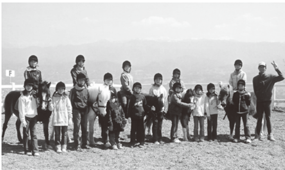
ポニーといっしょに

いいだ乗馬スポーツ少年団は小学一年生から高校生まで、総勢四十一名の子供達が毎日活動しています。平日は学校が終わってから、週末は約半日ポニーや馬達に乗ったり、世話をしたりしています。バランスや運動神経が良くなると共に、責任感や愛情も育んでいきます。