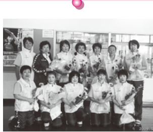
家庭婦人バレーボール連盟 第21回 全国家庭婦人いそじ大会出場 (11月13日～15日) 10月18日壮行会(鼎体育館)