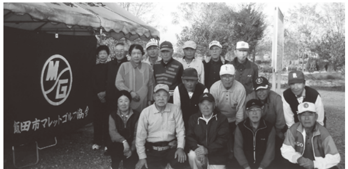
わたくしたち役員もお待ちしています

うち二回の大会は、地元の新聞社に依頼して市内の会員外の愛好者に幅広く参加を呼び掛け