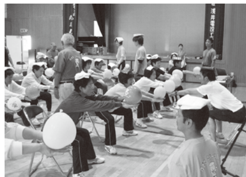
自分の体を意識して動きましょう!

れば指導者の責任で、選手の責任でないことを再認識すべきである。 この教室を通して、一人でも多くの国体選手やオリンピック選手が輩出できることを願っています。 多くの関係各位のご協力とご支援によりまして、この教室が終了できましたことを、実行委員長として御礼申し上げます。