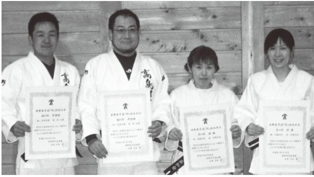
形の大会で大活躍

また、柔道には形 かた の大会もあり、技の基本原理を表した形を修得することも昇段の基準となっています。