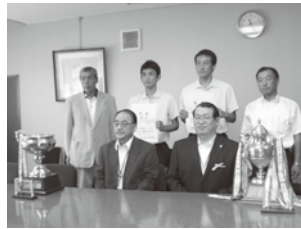
飯田ソフトテニス協会 長野県 ソフトテニス総合選手権大会 連続5回優勝 9月25日表敬訪問(市役所)