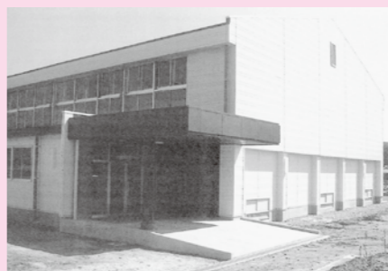
県切石体育館 全景