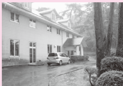
風越山麓研修センター 建物