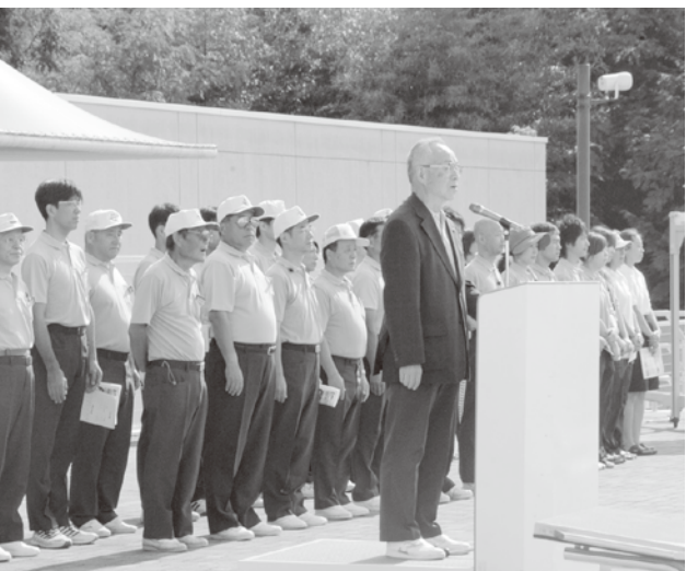
学童泳力テスト開会式

また、日本選手権、国体、インターハイ、全中、JOC等の全国大会に参加できる選手を毎年輩出し、上位入賞者も数多くいて、やがてはオリンピック選手が地元から誕生することを夢見て、選手強化にも力を入れて頑張っております。